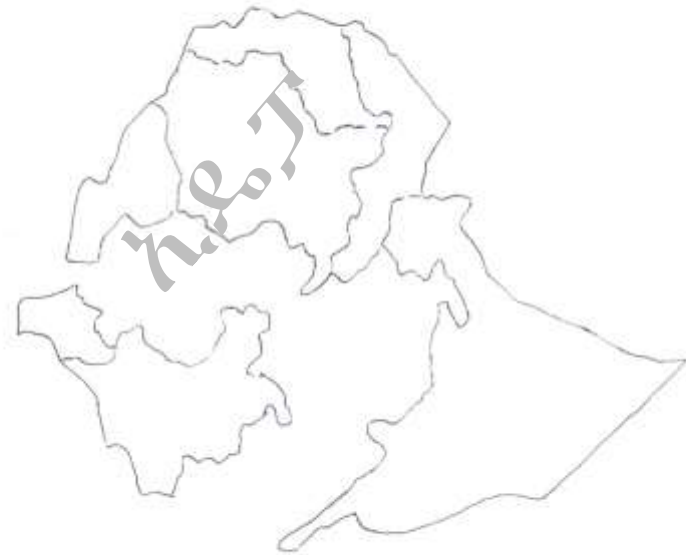
ካርታ ቁጥር 1 -የወቅቱ የኢትዮጵያ ካርታ